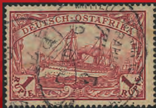
Mi.Nr. 381Ab gestempelt Michel: 30000,- Euro Ergebnis: 41400,- Euro