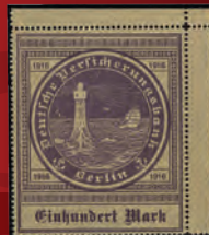
Mi.Nr. 16Y * Ergebnis: 19500,- Euro