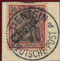
Mi.Nr. 13 Michel: 10000,- Euro Ergebnis: 10300,- Euro