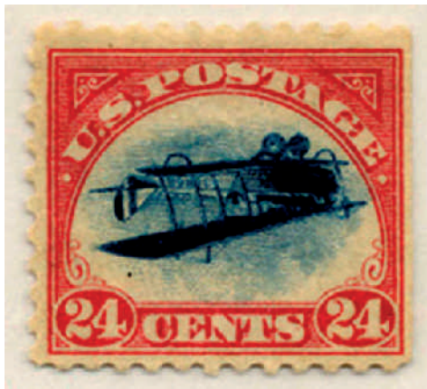
Der berühmte Fehldruck von 1918, Michel 250 I

Zur Eröffnung der Postfluglinie New York-Philadelphia-Washington erschien am 13. Mai 1918 ein Wert zu 24 Cent, der das Doppeldecker-Flugzeug „Curtiss JN-4 H Jenny“ zeigt (Michel-Nr. 250). Später wurden noch zwei Werte zu 6 bzw. 16 Cent mit dem gleichen Motiv ausgegeben. Diese erste US-Flugpostausgabe, die auch für die Normalpost zugelassen war, wäre heute eine von vielen Ausgaben gewesen, hätte nicht ein Sammler am Schalter einen 100er-Bogen erworben, bei dem das Flugzeug kopfstehend im Rahmen der Marke abgebildet war (genau genommen könnte man auch behaupten, dass nicht das Flugzeug, sondern der Rahmen ‚invertiert‘ wurde).