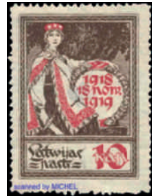
MiNr. 33: 1. Jahrestag der Unabhängigkeit (Abb. aus MICHEL Online-Katalog)