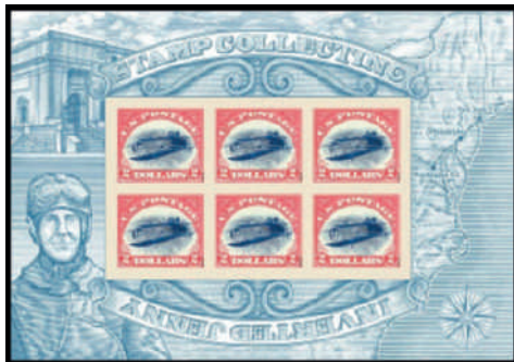
Der „normale“ Kleinbogen mit sechs Nachdrucken zu 2,00 Dollar.

Die selbstklebende Marke wurde in Kleinbogen (Folienbogen) zu sechs Stück in geschlossenen Verkaufsverpackungen angeboten. Auflage: 2,2 Millionen Bogen zu zwölf Dollar.