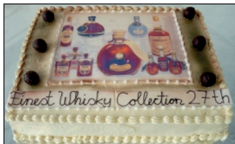
„Whisky-Torte“ zur Ausstellungs-Eröffnung

Präsentiert wurde in unzähligen Regalen und Vitrinen das Los mit der Nummer 18.268 der 27. Auktion (10. bis 14. Februar 2014). „Die einmalige Sammlung aus über 2.600 Einzelstücken besteht in ihrem Hauptteil aus ca. 1.000 verschiedenen hochwertigen Decantern, zum Teil handgearbeiteten Kristallkaraffen, feinsten Porzellan- und Keramikkrügen. Diese sind zu 98% mit exquisiten Malt Whiskys und zum Teil auch mit edlen Cognacs verfüllt und original wachsversiegelt.“, so das Auktionshaus.