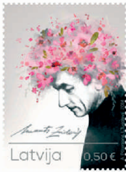
Erste Euro-Sondermarke Imants Ziedonis

„die 1991 in Unabhängigkeit der baltischen Staaten von der UdSSR führte. In einer Übergangsphase von knapp einem Jahr vor der Euro-Einführung erschienen die Werte mit beiden Währungsangaben. Die erste Marke in Doppelnominalen kam am 30. Januar 2013 „BMX-Radsport“ zu 35 S / 50 Cent (Michel-Nummer: 858) an die Schalter, Auflage: 300.000 Stück.