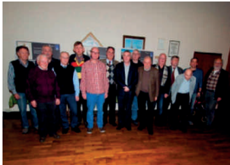
Der neu gewählte Vorstand des „Verein für Briefmarkenkunde Ulm/Neu-Ulm 1883 e.V.“, und 10 Mitglieder, die für ihre langjährige Mitgliedschaft geehrt wurden.

einem Geschenk beglückwünscht. Neben ihm wurden 10 weitere Mitglieder für ihre Treue zum Verein geehrt. Ein Geehrter zeigte mit einer großzügigen Spende seine Verbundenheit zum Verein.