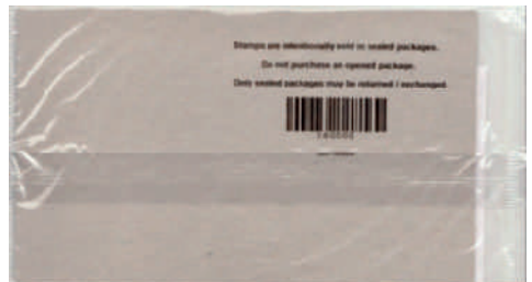
Die Verkaufsverpackung von der Rückseite

Der Hinweis auf der Folie, wonach sich die Briefmarken „absichtlich in versiegelten Packungen“ befinden und nur ungeöffnet verkauft werden dürfen, deutete schon auf eine Ausnahme hin.