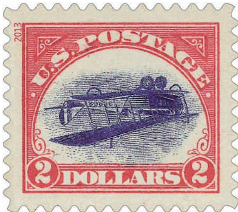
Der „normale“ Nachdruck, Michel-Nr. 5000 I BA

Der Auflage der Nachdruck-Marken zu 2,00 US$, die den Fehldruck mit dem kopfstehenden Doppeldecker ‚Curtiss JN-4H Jenny‘ darstellen, wurde von der US-Post eine Mini-Stückzahl mit einer „normal stehenden“ Jenny beigemischt.