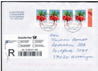
Portogerechte Vierer-Mehrfachfrankatur der neuen 60 Cent-Blumen-Marke aus Bogen. Einwurf-Einschreiben (nur innerh. Dtl.).

Mit den Tarifänderungen der Deutschen Post vom 1. Januar 2014 ist die einjährige Phase der ‚krummen Werte‘ vorbei. Sammlern von Belegen bieten sich wieder mehr Möglichkeiten für portogerechte Einzel- und Mehrfachfrankaturen.