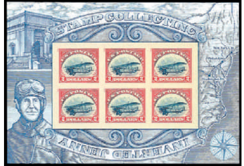
Nur 100 Kleinbogen (= 600 Marken) mit der gedrehten „Inverted Jenny“

Offensichtlich einige Tage nach dem Ausgabetag verkündete die US-Post offiziell, dass die Marken auf 100 Bogen den Doppeldecker in der normalen Stellung zeigen und auf die Gesamtauflage nach dem Zufallsprinzip verteilt wurden. Damit verwandelte sich das scheinbar normale Angebot der Post über Nacht in eine Art Verkauf von Lotterielosen.