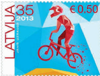
MiNr. 858: Erste Doppelnominal-Marke.

„die 1991 in Unabhängigkeit der baltischen Staaten von der UdSSR führte. In einer Übergangsphase von knapp einem Jahr vor der Euro-Einführung erschienen die Werte mit beiden Währungsangaben. Die erste Marke in Doppelnominalen kam am 30. Januar 2013 „BMX-Radsport“ zu 35 S / 50 Cent (Michel-Nummer: 858) an die Schalter, Auflage: 300.000 Stück.