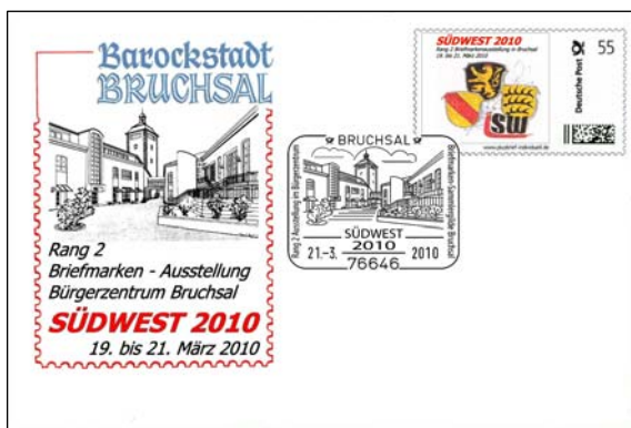
Beleg 1: Plusbrief Individuell mit dem Landesverbands-Logo im Werteindruck und Zudruck der Abbildung des Bruchsaler Bürgerzentrums (Preis 2,40 €).

Beleg 2: Plusbrief Individuell mit Abbildung Erwin Blask im Werteindruck sowie Zudruck des Sportlers mit einigen Stationen seines Lebens (Preis: 2,40 €).