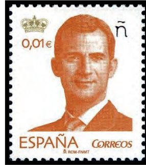
Der erste Wert der neuen Dauerserie „König Felipe VI. von Spanien“ (Mi 4941)

Im Oktober 2014 wurde Felipe VI. zum König von Spanien proklamiert. Damit wurde ein Dauermarkenwechsel erforderlich.