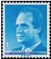
Ab 1985 (Mi 2678)