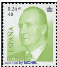
Ab 2001 (Mi 3628)