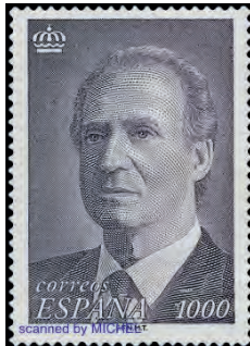
Ab 1993 (Mi 3117 und 3254)