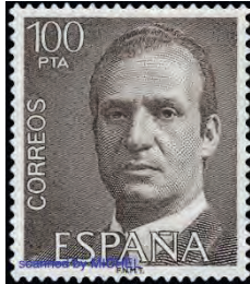
Ab 1976 (Mi 2237 und 2517)