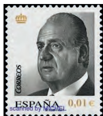
Ab 2007 (Mi 4193)

Nun kamen die ersten neuen Werte mit Sohn Felipe VI.