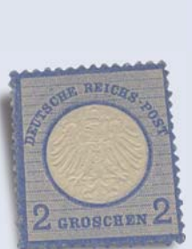
24. Auktion / Los 11.746 Ausruf: 4.000 € verkauft für: 12.400 € (inklusive Aufgeld ohne Steuer)

Einlieferungsschluss ist der 17. Juli 2013