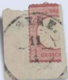
24. Auktion / Los 11.773A Ausruf: 20.000 € verkauft für: 44.400 € (inklusive Aufgeld ohne Steuer)